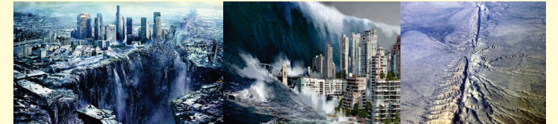
Falla de San Andrés

Habrán dos grandes terremotos; uno al inicio de los 7 años y otro al final; serán tan terribles que las islas se moverán de su lugar. Ap. 16: 18-20: “Entonces hubo relámpagos y voces y truenos, y un gran temblor de tierra, un terremoto tan grande, cual no lo hubo jamás desde que los hombres han estado sobre la tierra. Y la gran ciudad fue dividida en tres partes, y las ciudades de las naciones cayeron; y la gran Babilonia vino en memoria delante de Dios, para darle el cáliz del vino del ardor de su ira. Y toda isla huyó, y los montes no fueron hallados”. Dios da señales de que esto ocurrirá en las grandes fallas geológicas como la de San Andrés.