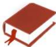
El Libro de las obras