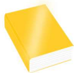
El Libro de la Vida