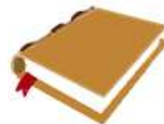
El Libro de la Ley