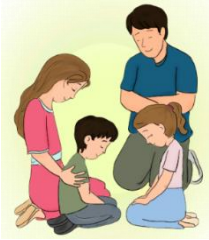
Oremos a Dios

3. En la última hoja encontrarás el dibujo de una iglesia para que representes la tuya. Decórala y escribe todos los dones en los que ha sido enriquecida para ser una Iglesia santa y sin arruga.