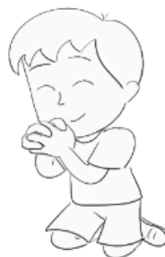
Cumpliendo la Misión de orar por los perdidos.