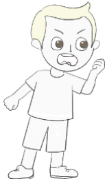
Siendo desobediente y practicando las obras de la carne.