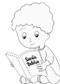
Leyendo la Palabra y obedeciéndola.