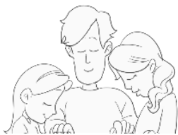
Orando con fe por ser hallados dignos de escapar.