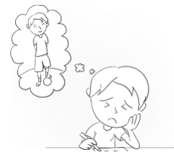
Estando distraídos todo el día.