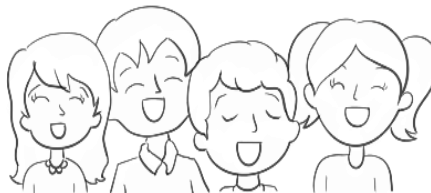
Adorando a Dios con cántico nuevo y voz de júbilo.